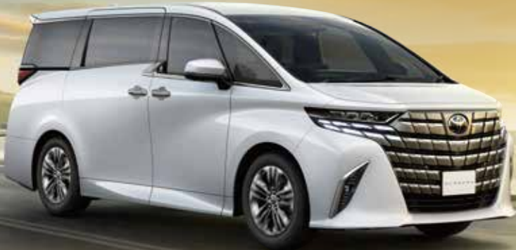
Photo:アルファード Z (ガソリン・4WD). ボディカラーのプラチナホワイトパールマイカ(089)(33,000円)はメーカーオプション。